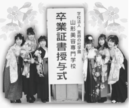
山形美容専門学校 卒業証書授与式

私も、彼らと、夢や目標を語り合いたいと強く思いました。そこで、初めて、自分自身の、本気の気持ちと向き合い、どんな美容師になりたいのか、どんな人間になりたいのか、真剣に考えることができました。そして、夢が明確になりました。私は夢が明確になることで、意識が変わりました。更に、声に出して言い続けることで、自分自身が、夢を実現させる為に行動するようになりました。このような経験から、限り有